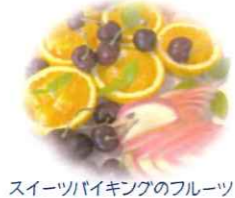
スイーツバイキングのフルーツ