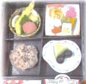
敬老の日の「松花堂弁当」