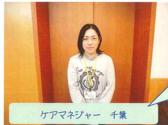
ケアマネジャー 千葉

管理栄養士と厨房スタッフが協力し、毎食ま ごころを込めたお食事を提供しています。 季節に合わせて特別メニューもありますヨ！ 皆さんとても楽しみにされています♡