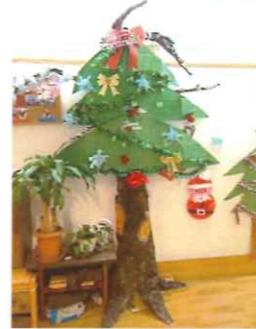
クリスマスパーティーではツリーに変身!