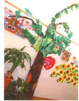
夏場は青々とした葉と赤い実がなり、